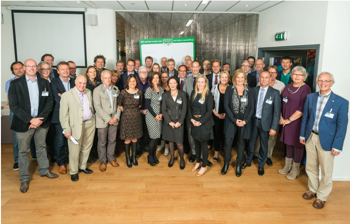
Ondertekening intentieverklaring samenwerking 15 oktober 2014