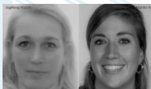
14-02-2022 | Nieuwscategorie