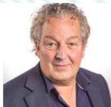
24-11-2021 | Nieuwscategorie