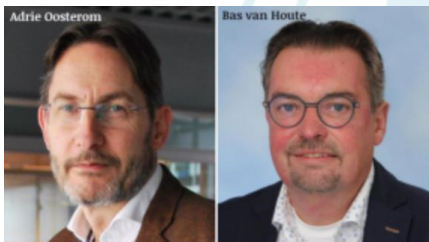
27-10-2021 | Nieuwscategorie Oktober. Vo-afdelingsleider en werkgroep aan het woord: 'Met vaardighedenraamwerk de ontwikkeling van vaardigheden zichtbaar maken'

LinkedIn-groep samenwerkingsverband vo-ho www.aansluiting-voho010.nl