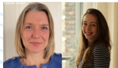
20-12-2021 | Nieuwscategorie