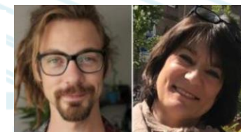
22-12-2021 | Nieuwscategorie